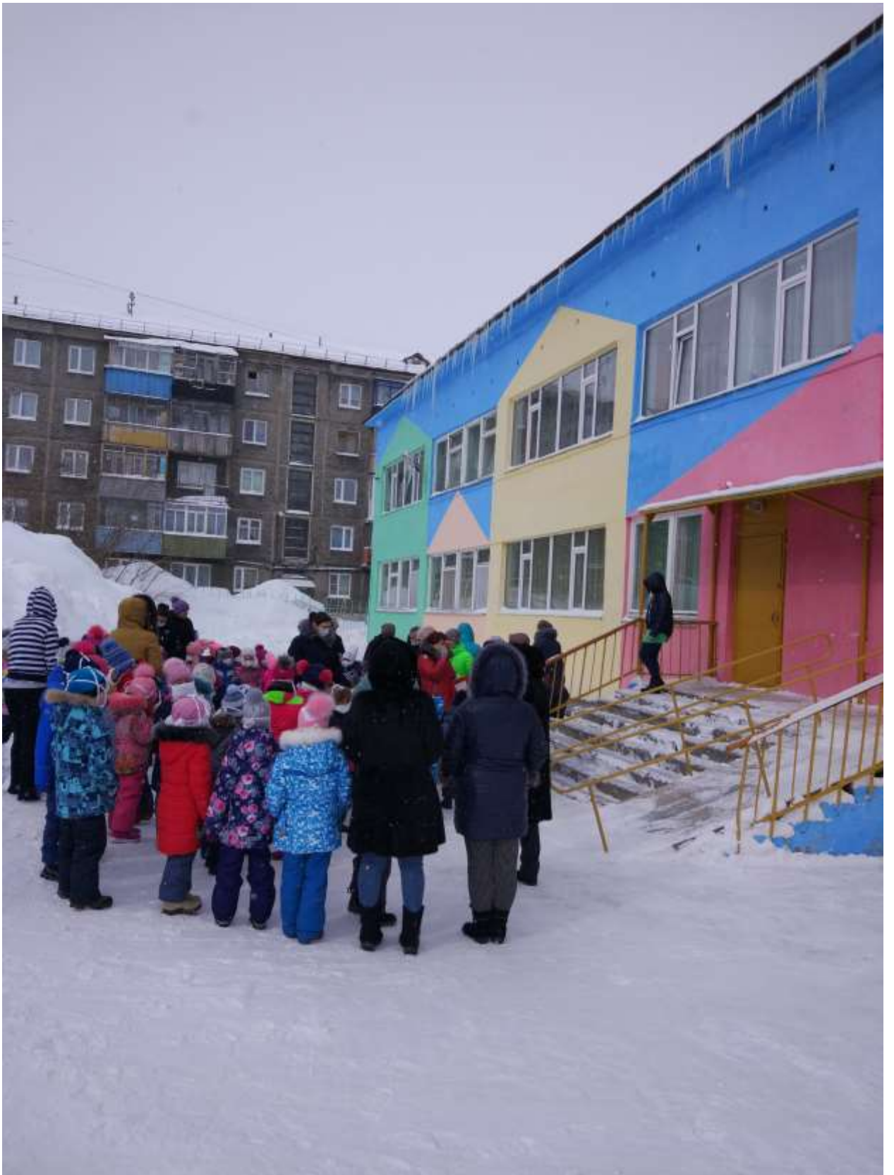
Тренировка по эвакуации в МДОУ Детский сад № 14