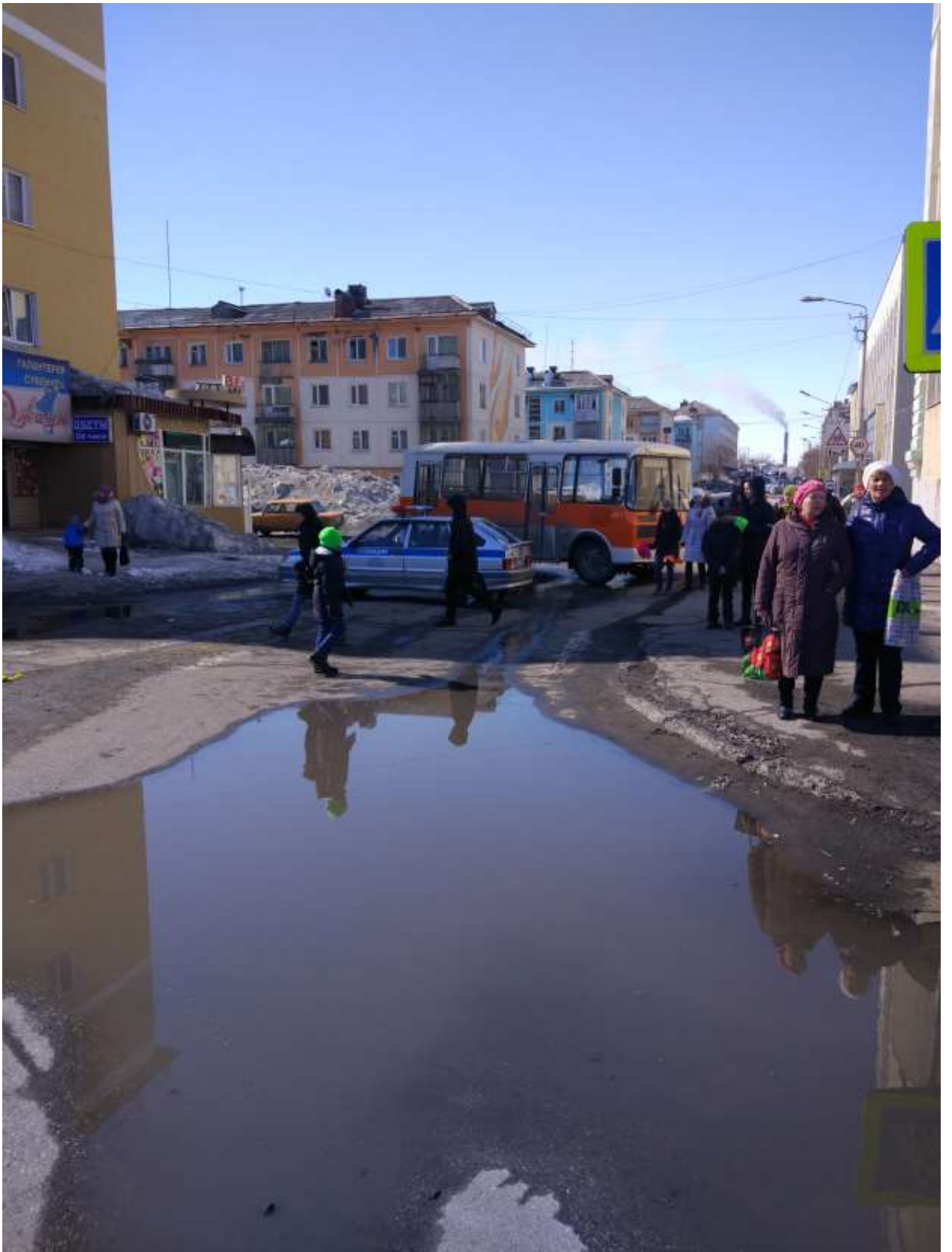
Перекрытие движения при проведении праздничных, городских мероприятий (ф5)