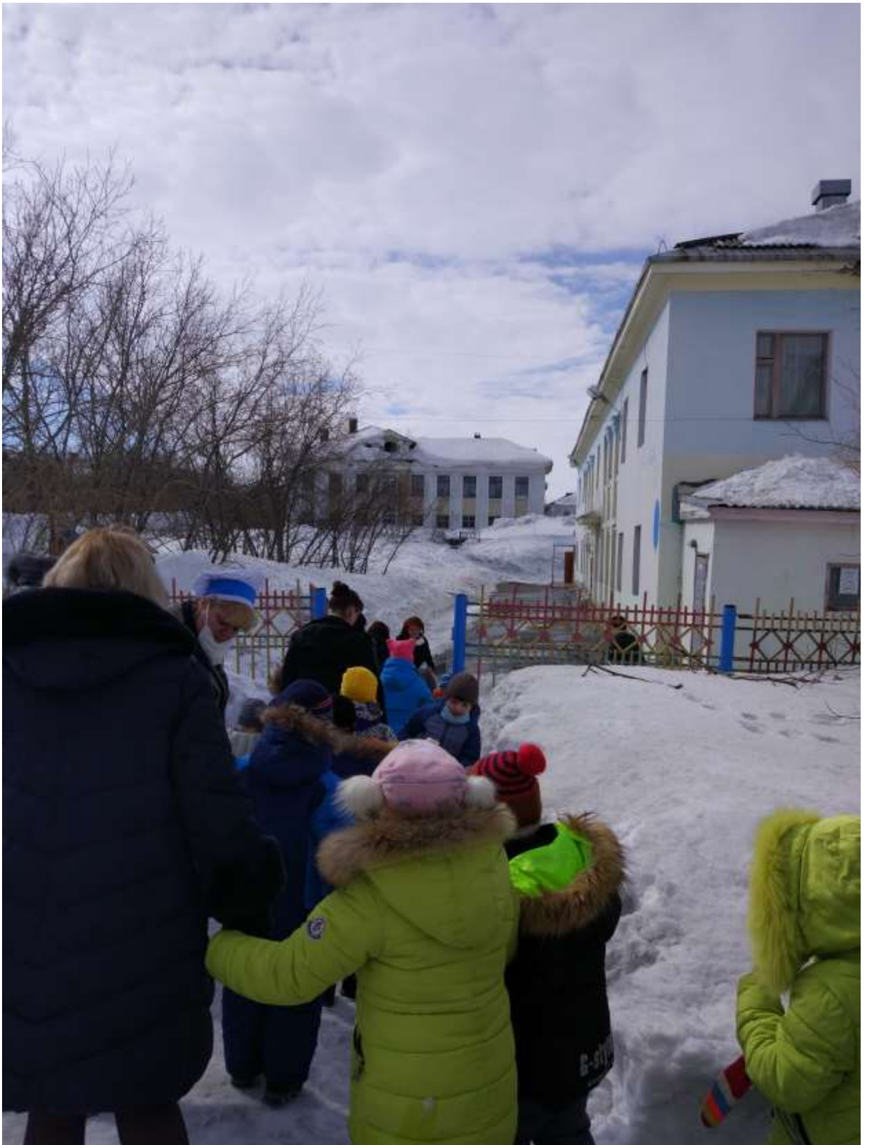
Тренировка по эвакуации в МДОУ Детский сад № 26