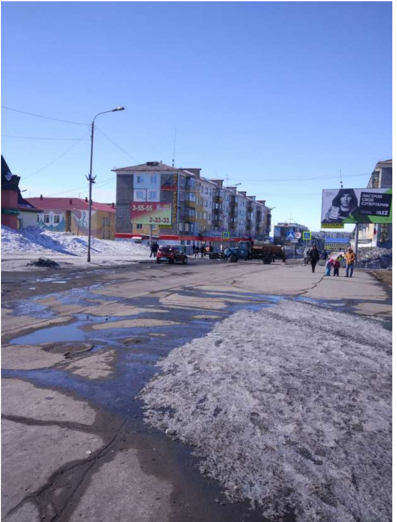
Перекрытие движения при проведении праздничных, городских мероприятий (ф2)