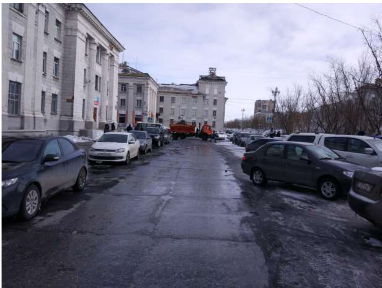
Перекрытие движения при проведении праздничных, городских мероприятий (ф1)

20.06.2018 состоялось внеплановое заседание Антитеррористической комиссии МО ГО «Воркута», на котором было рассмотрено 2 вопроса. Оба вопроса рассматривались по инициативе Антитеррористической комиссии МО ГО «Воркута».