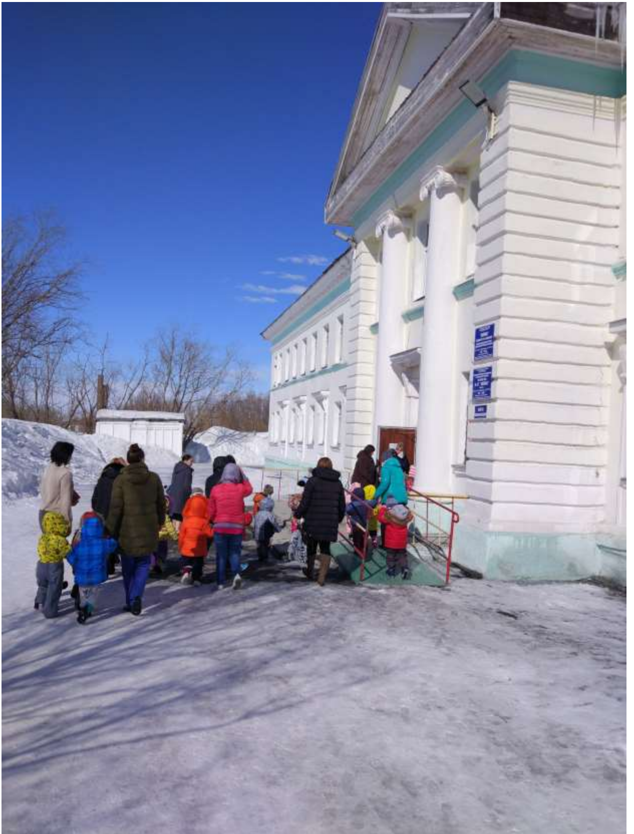
Тренировка по эвакуации в МДОУ Детский сад № 27