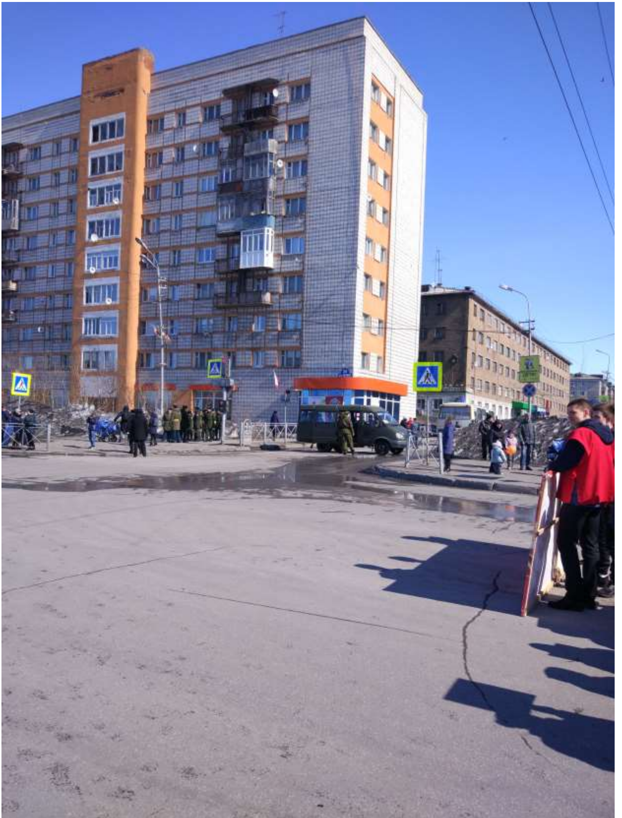
Перекрытие движения при проведении праздничных, городских мероприятий (ф3)